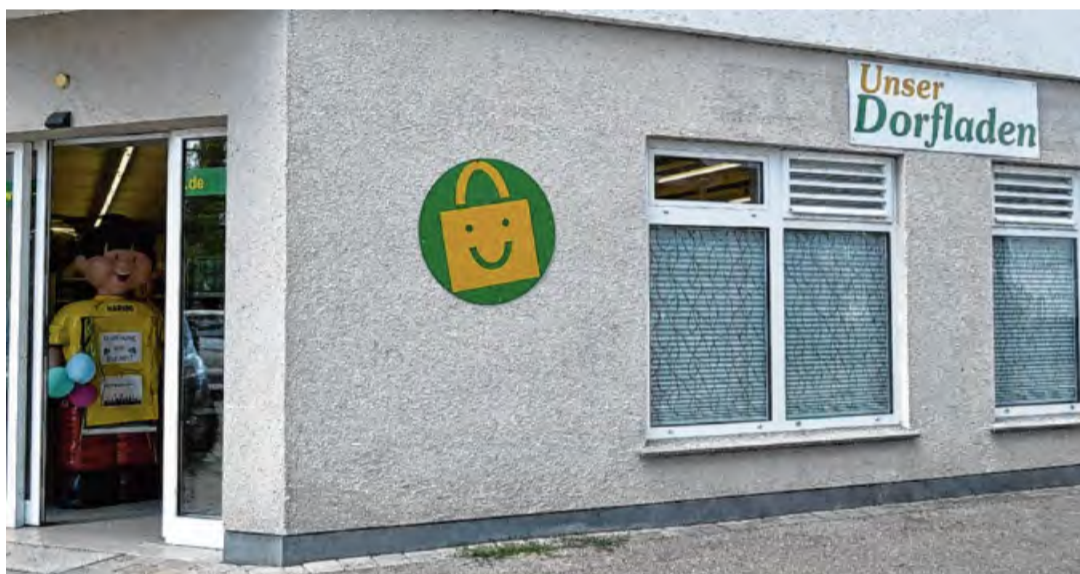
In einem ehemaligen Schlecker-Markt ist der neue Dorfladen entstanden.